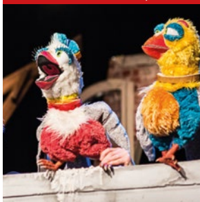
Dziób w dziób, Teatr Animacji