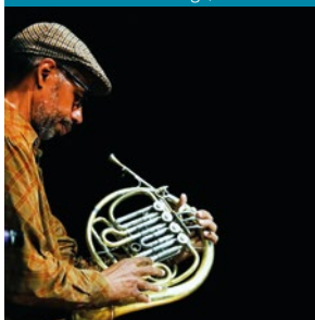
Festiwal Made in Chicago, 20-22.05