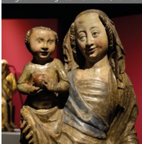
Wystawa Imagines Medii Aevi , do 17.07