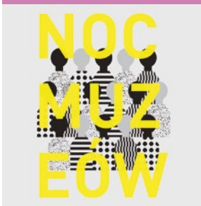
Noc Muzeów, 21.05